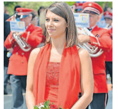
Gretzenbacher Ehrendame in Rot

wiesen, eine absolut realistische Beurteilung.