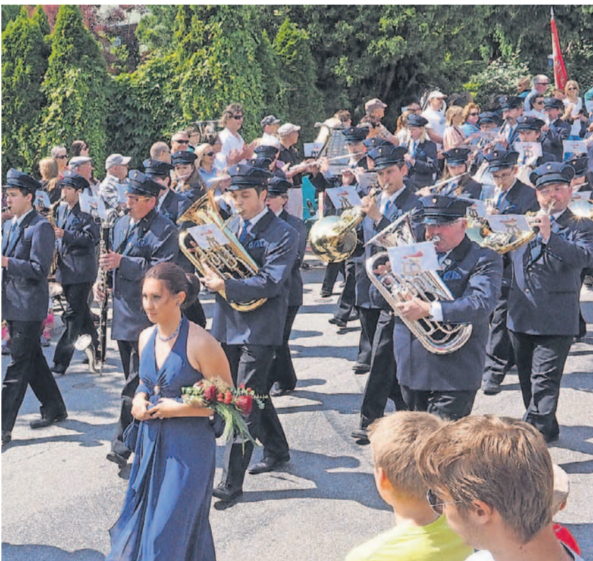
Sieger der Marschparade vom Sonntag: Konkordia Balsthal