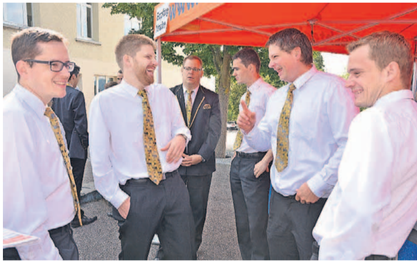
Gut gelaunt: Winznauer Musikanten