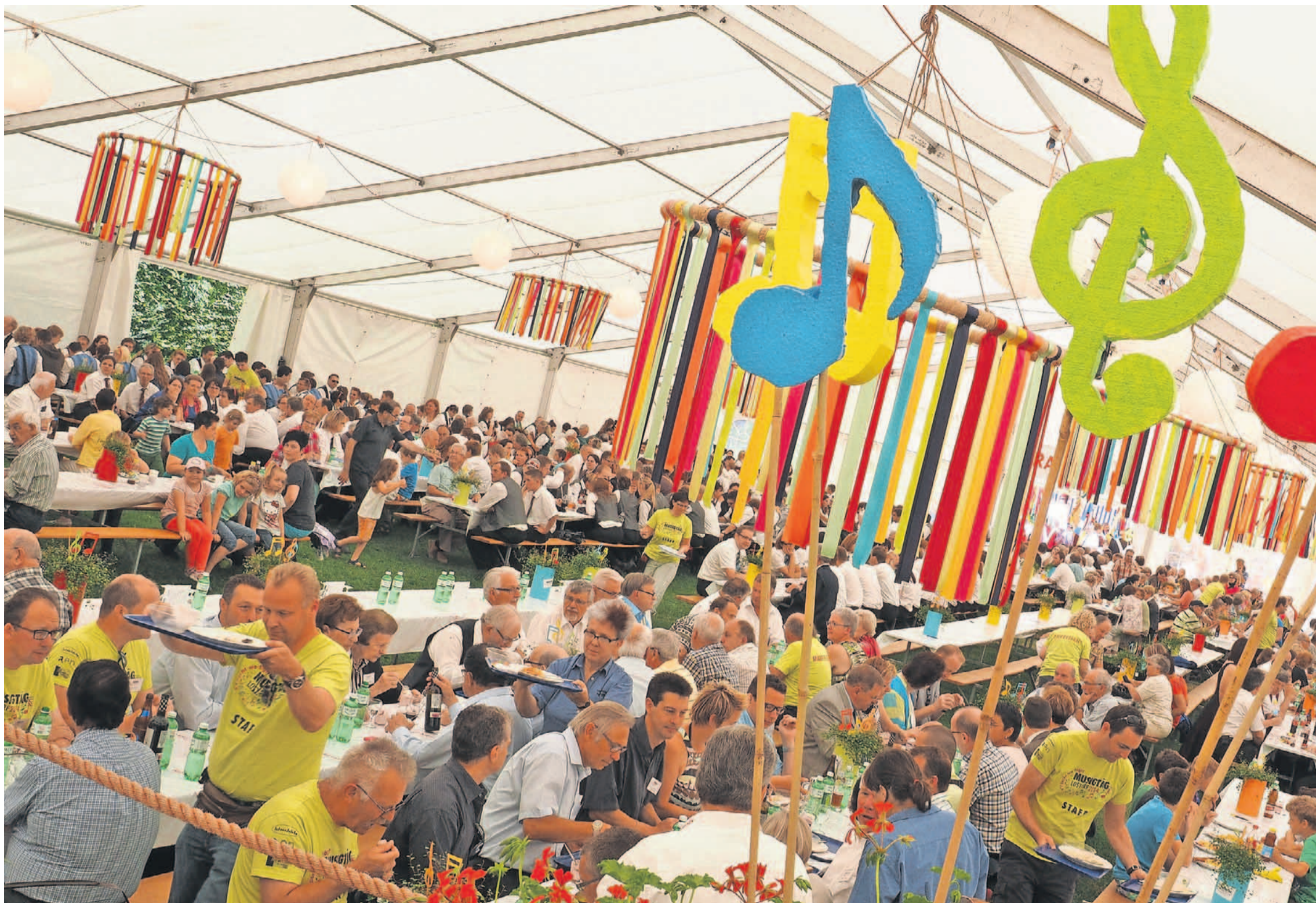
In jeder Hinsicht ein farbenfrohes Fest: Die Regionalmusiktage 2014 des Musikverbandes Thal-Gäu-Olten-Gösgen in Lostorf