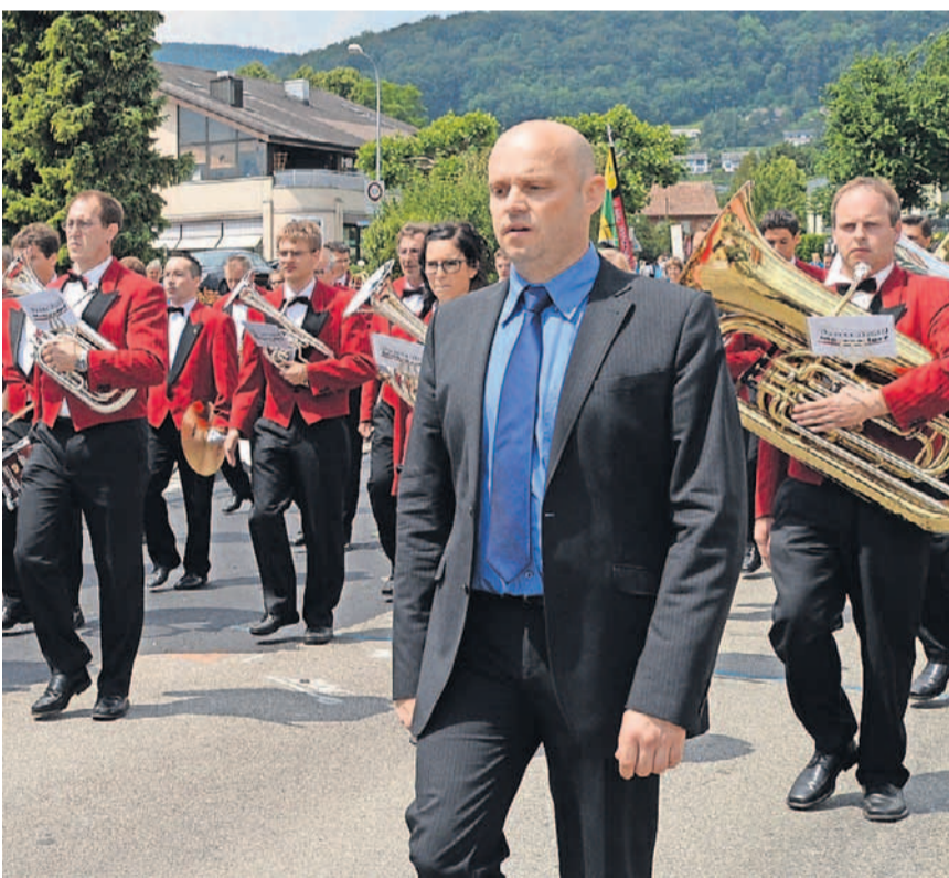
Sieger der Marschparade vom Samstag: Brass Band Matzendorf