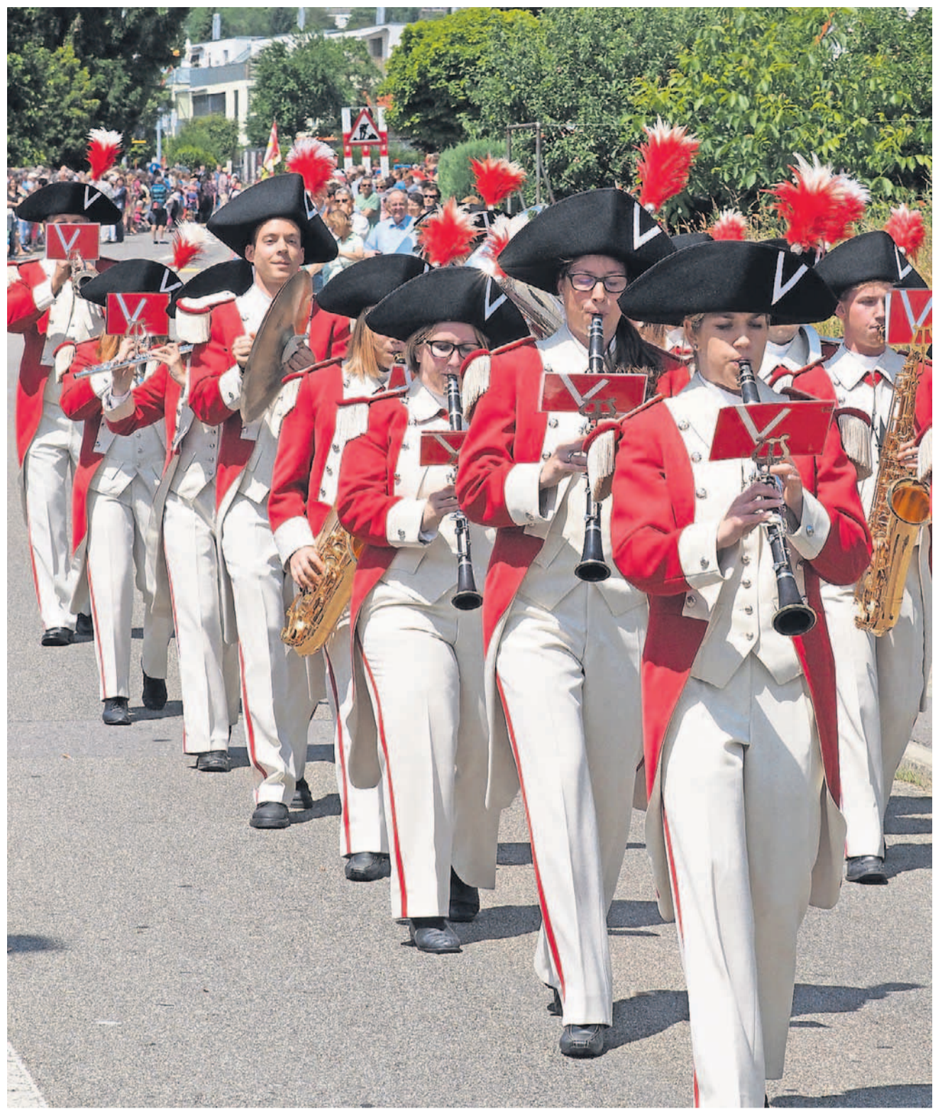
Harmonie Musikgesellschaft Fulenbach