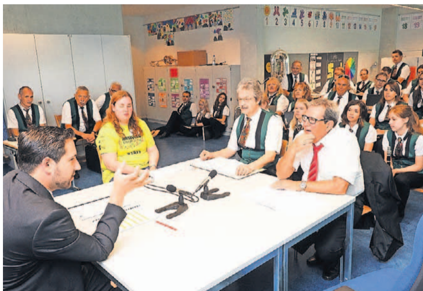
Musikgesellschaft Hägendorf-Rickenbach beim Expertengespräch